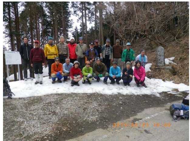
巡検に参加したメンバー（表丹沢林道にて）