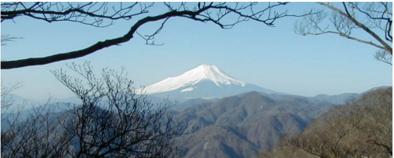
桧洞丸から眺める富士の白雪

連盟は、登山が楽しく安全であるための活動のほか、「自然を尊ぶ心、ローインパクト登山」を唱え、丹沢をフィールドに山の環境保全活動にも取り組んでいます。