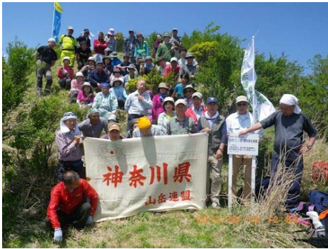
第五回環境登山(5月18日開催)

神奈川県山岳連盟の創立 50 周年(平成 14 年)を記念して実施された清掃登山は 2009 年(平成 21 年)で 7 回目を迎えたことを機に、活動名称を環境登山と改称し、