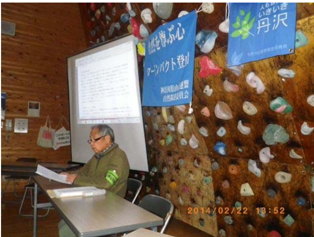
神奈川の森林について解説する講師

日山協公認自然保護指導員・環境省公園指導員（神奈川県山岳連盟関係）の育成・自己研鑽に加え、連盟会員・一般の方々へ、広く山岳自然について理解を深める機会として、毎年1回開催している。平成25年度は県立山岳須ポールセンターを利用して1泊2日の日程で開催した。