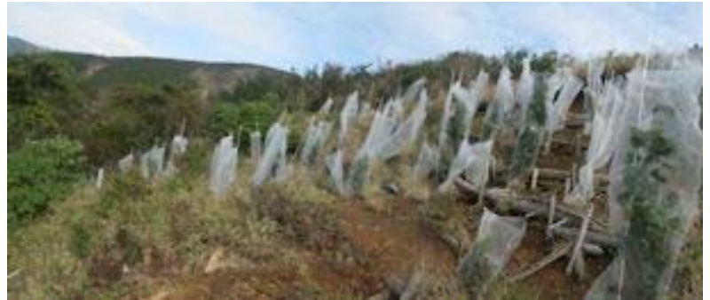
二ノ塔山腹の植栽(右図)

クリーン活動以外に、裸地化した山腹の植生回復へ移行しました。着手後 3 年間ほど試行錯誤を重ね、2012 年、2013 年と活着に成功。山腹には 100 本を超える植栽苗(ケヤマハンノキ)を定着させた。こうして得たノウハウをもとに、活動を拡大し、2014 年春には、神奈川県山岳連盟の創立 60 周年を記念もあり、丹沢由来のケヤマハンノキ 200 本を植栽した。