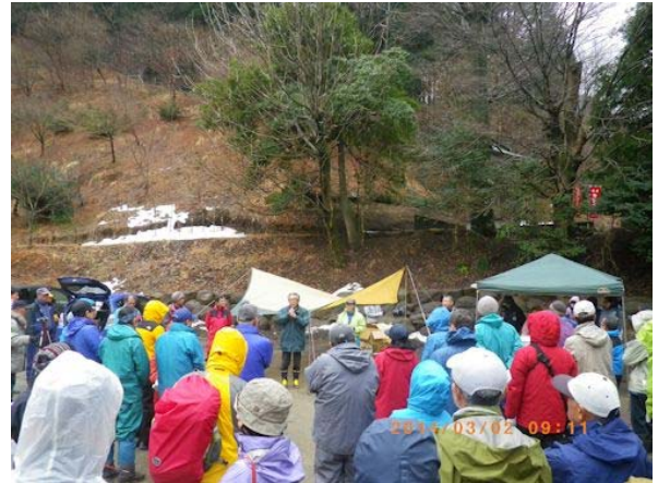
広沢寺清掃集会に集まった登山者のみなさん