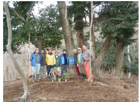
一日の整備作業を終えて

生活動」を実施している。丹沢大山の自然再生へ寄与することを願って、2009 年に実行委員会を発足して森林づくりボランティア活動をスタートさせました。森林活動を通して、参加者の自然保護意識の啓発や自然体験活動だけでなく、環境面の社会貢献のひとつとして活動しています。神奈川県山岳連盟の社会貢献活動と位置付け、「県民との協働による森林づくり実行委員会」が募集する「定着型森林づくりボランティア活動」事業の助成を得て行っている。