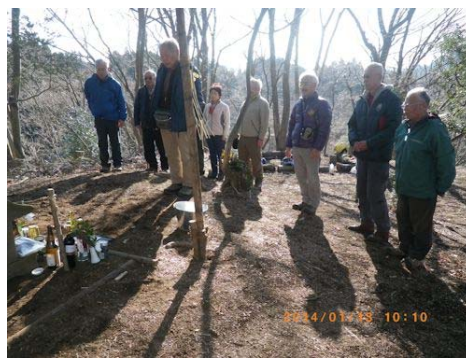
山神祭りに集うメンバー

神奈川県が実施する「未来につなぐ森づくり・神奈川森林再生 5 年構想」に賛同して、平成 21 年から向こう 10 年間にわたり、森林再生活動に取り組むこととし、宮ヶ瀬湖畔の煤ヶ谷水源林内の指定地約 8 ヘクタールにて、「森林再