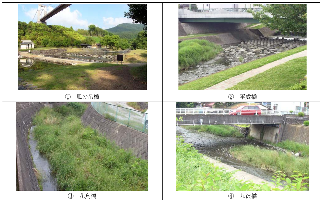
図 2 採水地画像