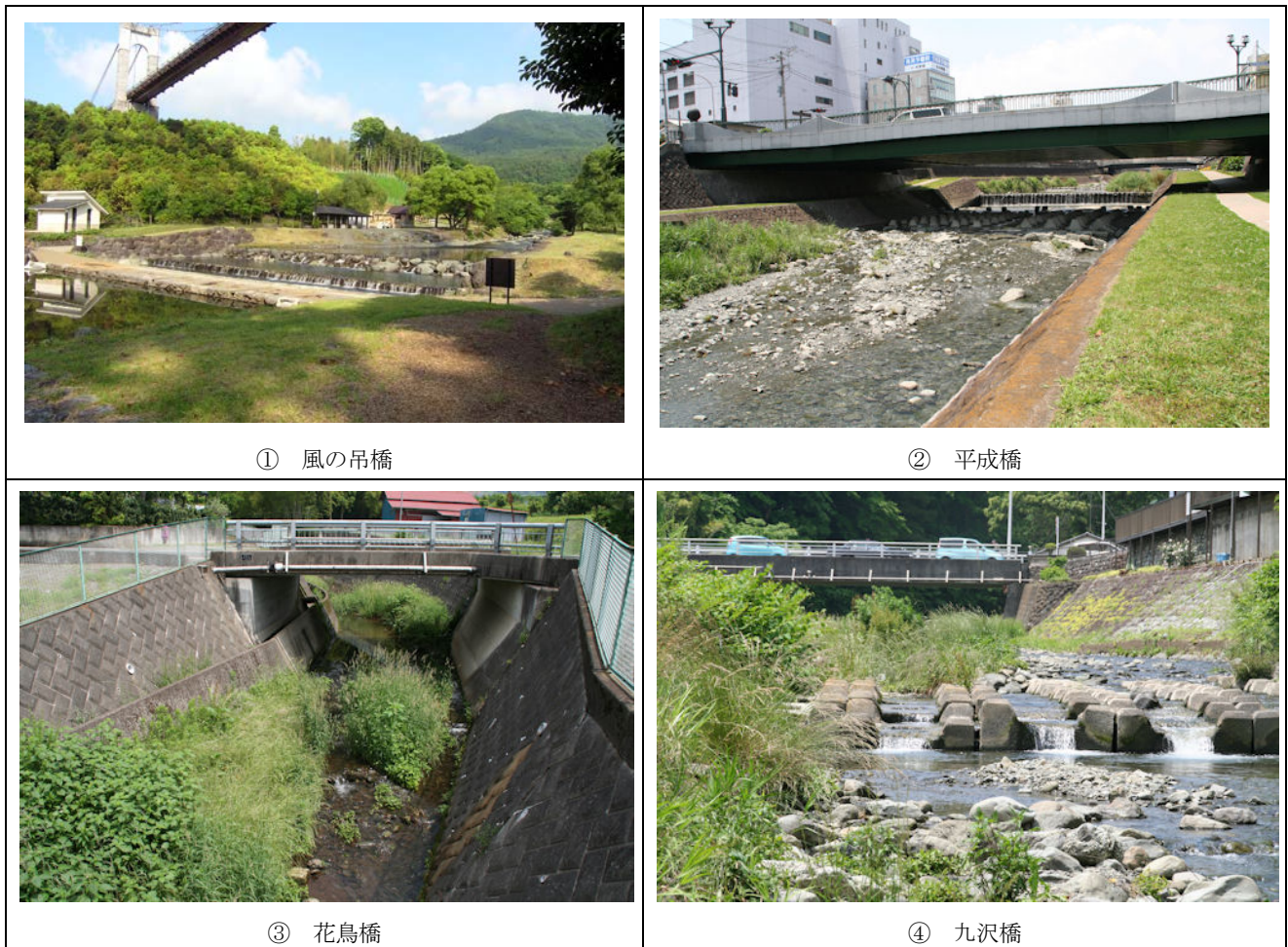
図 2 採水地画像