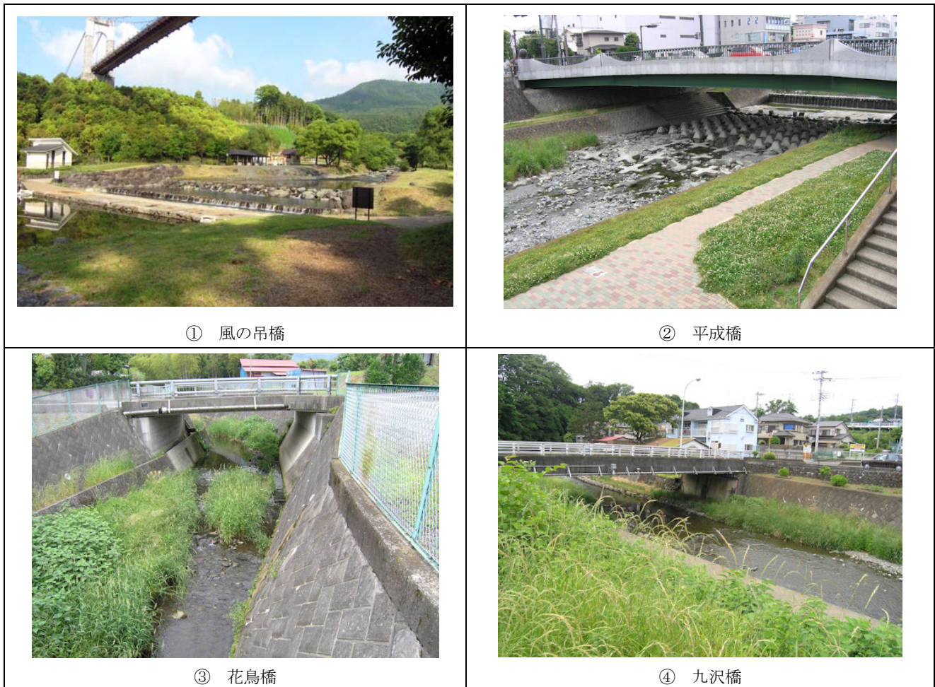
図 2 採水地画像